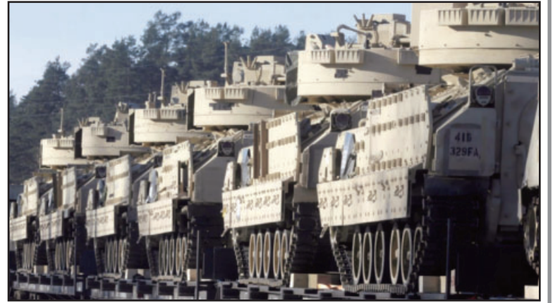
До рекордного 29 пакету допомоги увійшли обіцяні 50 броньованих машин піхоти M2 Bradley.