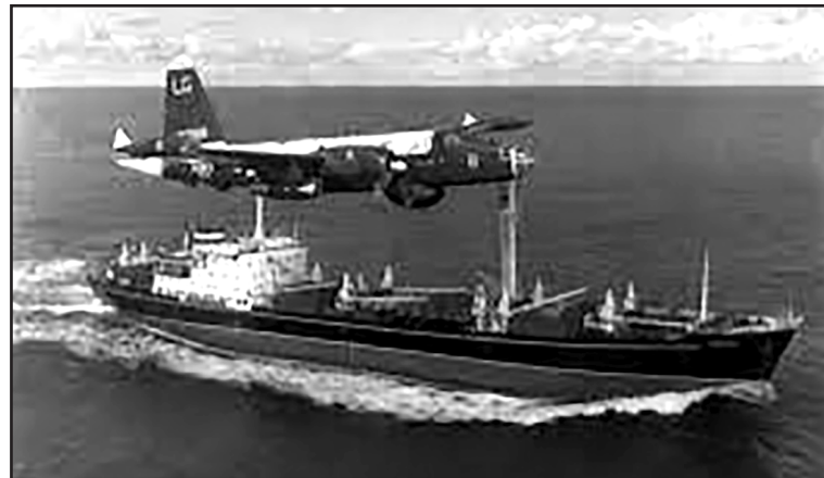
1962 рік. Попереду – Куба.

зробила свій вибір на користь ефіопського правителя Менгісту Хайле Міріама.