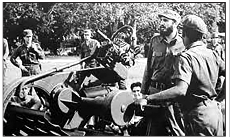
Радянська бойова техніка на Острові Свободи.

Рейс судна подвійного призначення «Юний ленінець» у травні 1986 року з вантажем бойової техніки і прикордонними катерами на борту – лише один із тисяч епізодів «міжна-