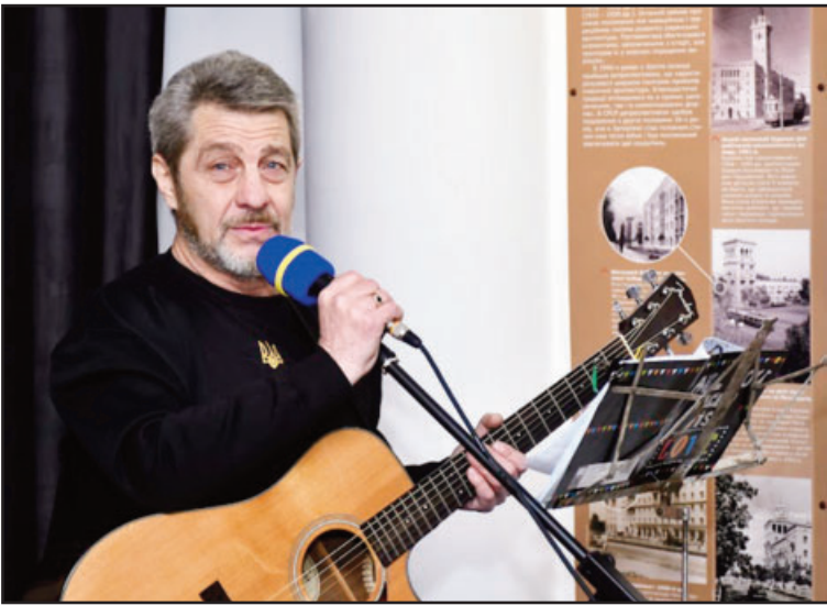
У «Гвардійській вітальні» Запорізького гарнізону Національної гвардії України відбулась творча зустріч з автором і виконавцем гімну воїнів-інтернаціоналістів «Віват, Афганістан!» Юрієм Шкітуним.

ВОНА РОЗПОЧАЛАСЯ з відеокліпу, в якому твір запорізьця Шкітуна співають представники багатьох країн світу. Шкітун вміє «завести» зал. Його знімали на мобільні телефони, йому підспівували, йому щиро й довго аплодували. Разом з відомими й популярними піснями Юрій Петрович виконав і нові, центральною темою яких була сьогоденна війна. Гучними оплесками присутні зустріли повідомлення про те, що автор поступово переходить до написання пісень українською.