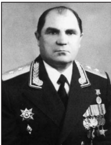
Генерал-полковник ГЕНЕРАЛОВ Леонид Евстафьевич