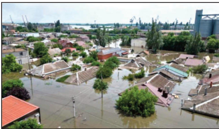
Херсон під водою та обстрілами. Скільки біді людям і скільки втрат багатств України спричинив варварський підрив агресором греблі Каховської ГЕС...

Ще у 2014 році Україна втратила майже 100% доломітів для металургії, 100% карбонатної сировини для виробництва карбонату натрію, 90% піленого каменю, понад 80% родовищ флюсової сировини, понад 95% родовищ вогнетривких глин, а