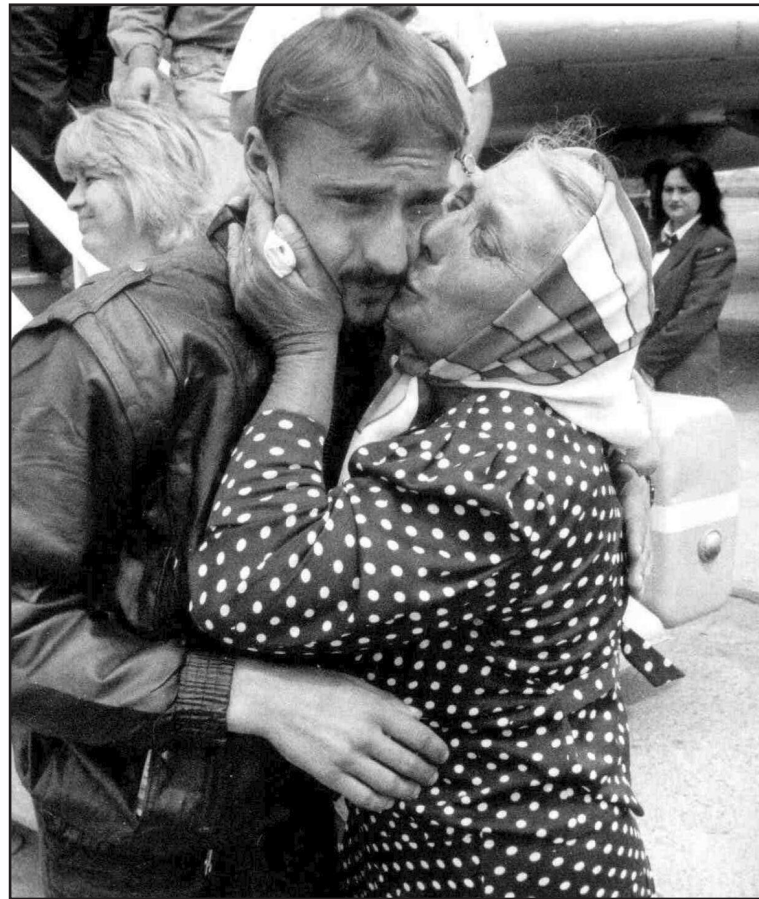
Дочекалася мама сина. Аеропорт «Бориспіль», травень 1996 року.

Ненависть. Глуха, сліпа, і жодною логікою її не оминуть, не пройти. Господарі прийому – співробітники пакистанського посольства були дуже уважні. Їхні стосунки з моджахедами можна було пояснити. Коли до сивобородих керівників опозиції підійшов стрункий, поголений, з неприхованою військовою виправкою пакистанець, вони всі піднялися, висловлюючи повагу, і вислухали його вітання стоячи.