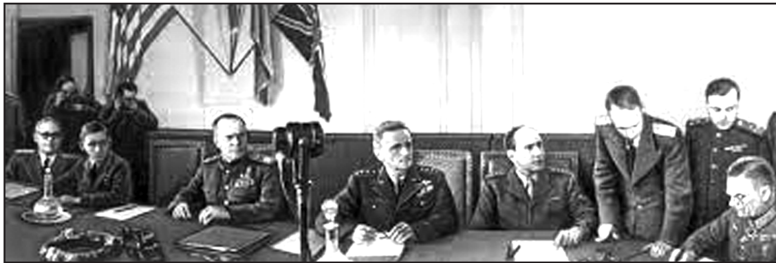
Підписання Акту про беззастережну капітуляцію фашистської Німеччини.

Гітлерівське командування, дізнавшись про наміри Хорті "зрадити Німеччину", терміново перекинуло в район Будапешта великі танкові сили. Крім того, наказом по військам групи армій «Південь» від 4 жовтня 1944 року передбачалася низка заходів щодо припинення антинімецької діяльності, встановлювався контроль за засобами зв'язку угорських воєначальників і представників влади, а також безпосереднє спостереження за вищим угорським командуванням через офіцерів зв'язку.