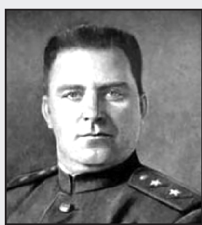
Дерев'янку Кузьма Миколайович (14 листопада 1904 — 30 грудня 1954) — радянський воєначальник, генерал-лейтенант. Герой України (2007).

У Манілі 27 серпня К. М. Дерев'янку отримав телеграмою наказ про перепідпорядку-