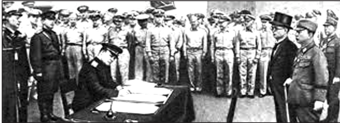
Церемонія підписання Акту про капітуляцію Японії.

Союзники погодилися з цією вимогою і Акт був підписаний в ніч з 8 на 9 травня 1945 року в 0 годин 43 хвилини у передмісті Берліна