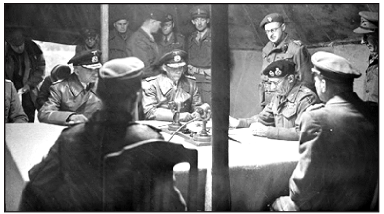
Підписання капітуляції в Люнебурзькій пустині.

Першим пунктом умови говорилося, що Угорщина вийшла з війни, розірвала відносини з Німеччиною, оголосила їй війну, зобов'язуючись інтернувати всіх громадян Німеччини на своїй території, виставити проти Німеччини не менше 8 піхотних дивізій