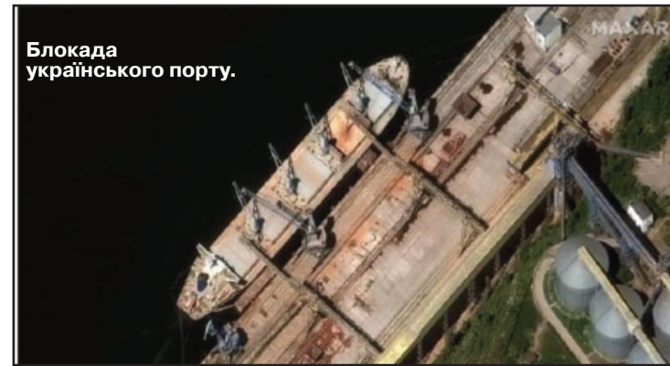
Блокада українського порту.