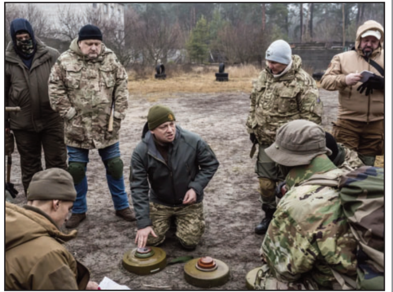
Українські партизани сьогодні.