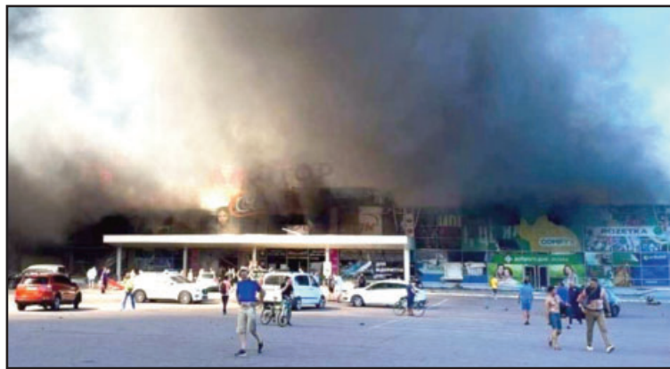
Ракетний удар по торговому центру «Амстор» у Кременчуку

Ракетний удар по ТЦ «Амстор» 27 червня. Ракети Х-22 росія запустили зі стратегічних бомбардувальників Ту-22М3, що злетіли з аеродрому Шайковка, а пуски здійснювали з Курської області.