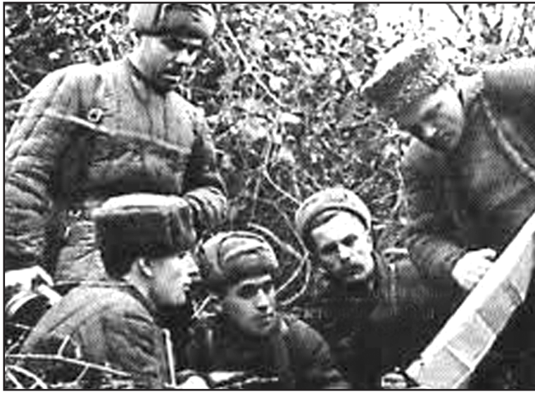
Бійці п'ятого українського фронту років Великої Вітчизняної війни.

У 1920-х – на початку 1930-х років у СРСР підготовці до можливої партизанської війни приділяли значну увагу: проводився облік кадрів підпільників і партизанів, аналіз досвіду підпільної та партизанської боротьби в період Громадянської війни та військової інтервенції, а також досвіду партизансько-повстанських рухів інших народів і досвіду «малої війни», накопиченому російською армією. Було організовано роботу з написання наукових праць і навчальних посібників з тактики партизанської боротьби, створення партизанських шкіл, а також спеціальної техніки та озброєння для партизанських формувань.