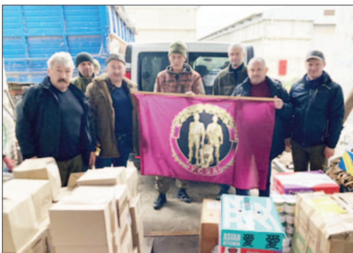
Волинська обласна організація Української Спілки ветеранів Афганістану 2014 року створила волонтерську групу, яка більше дев'яти років займається підтримкою Збройних Сил України. В АТО, ООС і зараз на фронт «афганці» доставляють все необхідне, що потребують наші військові.