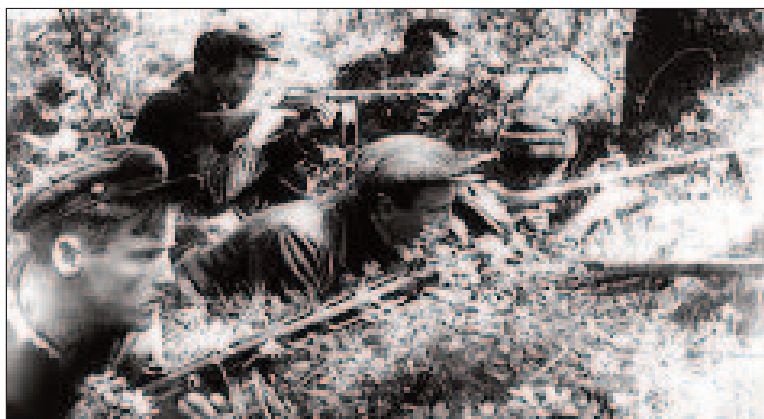
Українські партизани Другої світової.

частин супротивника, 13 одиниць бронетехніки, 190 гармат, 67 протитанкових рушниць, 506 мінометів і гранатометів, 3217 станкових і ручних кулеметів, 5971 автоматів, 60355 гвинтівок, 2903 пістолета, 63303 артилерійських снарядів і мінометних мін, 12,2 млн патронів, 27245 ручних гранат, 28 тонн вибухівки, 12,2 тонн пального, 172 склади, 987 автомашин, 43 трактори, 5 паровозів, 210 вагонів і платформ, 30361 коней, 5314 возів, 1467 седел, 86 радіоприймачів, 1541 телефонних апаратів, 57 біноклів, обмундирування та значну кількість іншого військового майна і трофеїв.