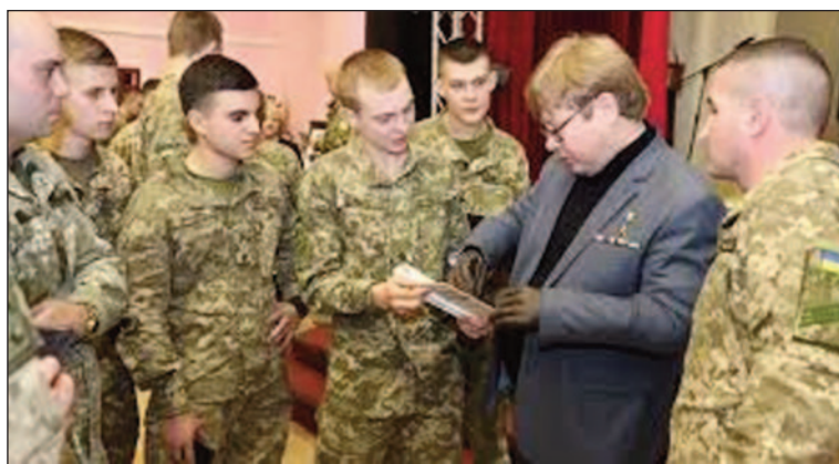
Герой України Володимир Жемчугов.

Світова воєнна історія показала, що на всіх окупованих загарбниками територіях завжди діяли сили опору. Не стала винятком із цього правила Україна і в роки Другої світової війни у жорсткій боротьбі з німецькими, румунськими, угорськими та іншими окупантами, і сьогодні, у запеклій відсічі російському агресорові.