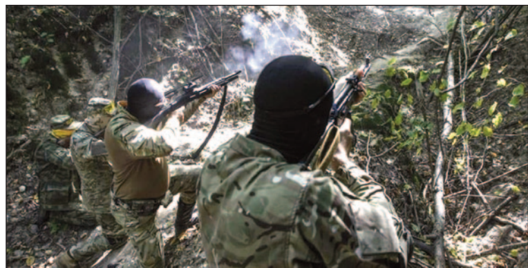
Сучасні українські партизани не дають спокою окупантам.

За участь в антифашистській боротьбі у підпіллі та партизанських загонах на території УРСР радянсь-